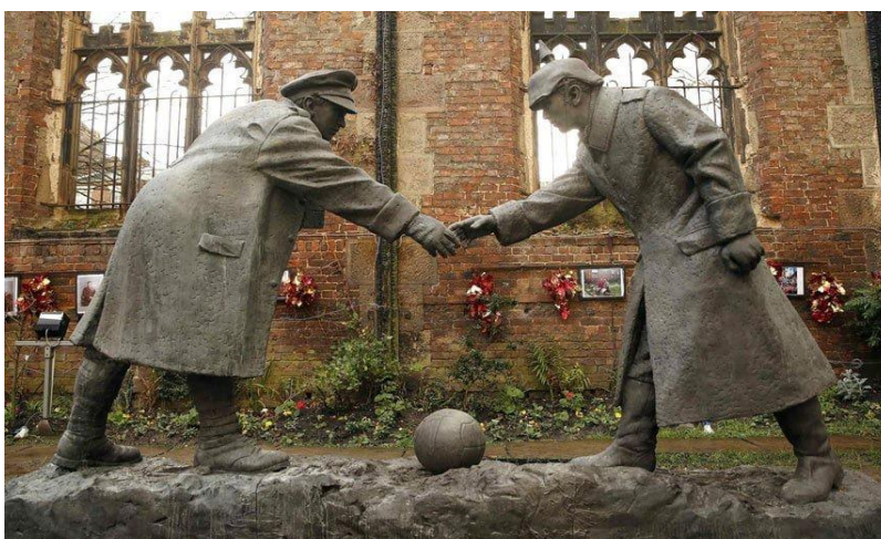
Фото 5. Скульптура яка символізує різдв'яне перемир'я 1914 р.

У Різдво 1914 року, під час Першої Світової війни, німецькі та англійські солдати на лінії фронту влаштували незаплановане перемир'я. Вони співали різдвяні гімни, обмінювалися надісланими з тилу подарунками і грали в футбол. У наступні роки війни організувати подібні перемир'я вже не вийшло.